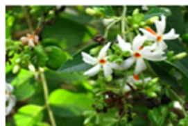
7. Nyctanthes arbor-tristis