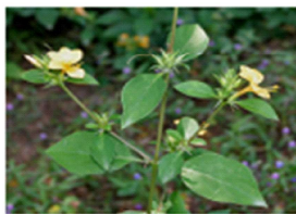
3. Barleria prionitis