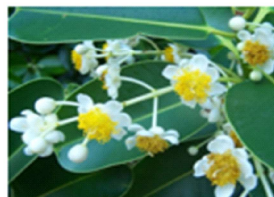
4. Calophyllum inophyllum