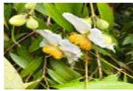
2. Mussaenda frutescens