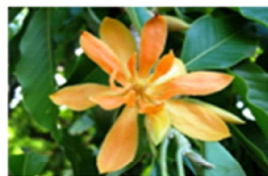
5. Michelia champaca