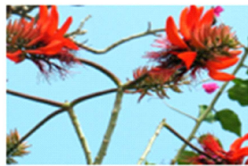
1. Erythrina indica